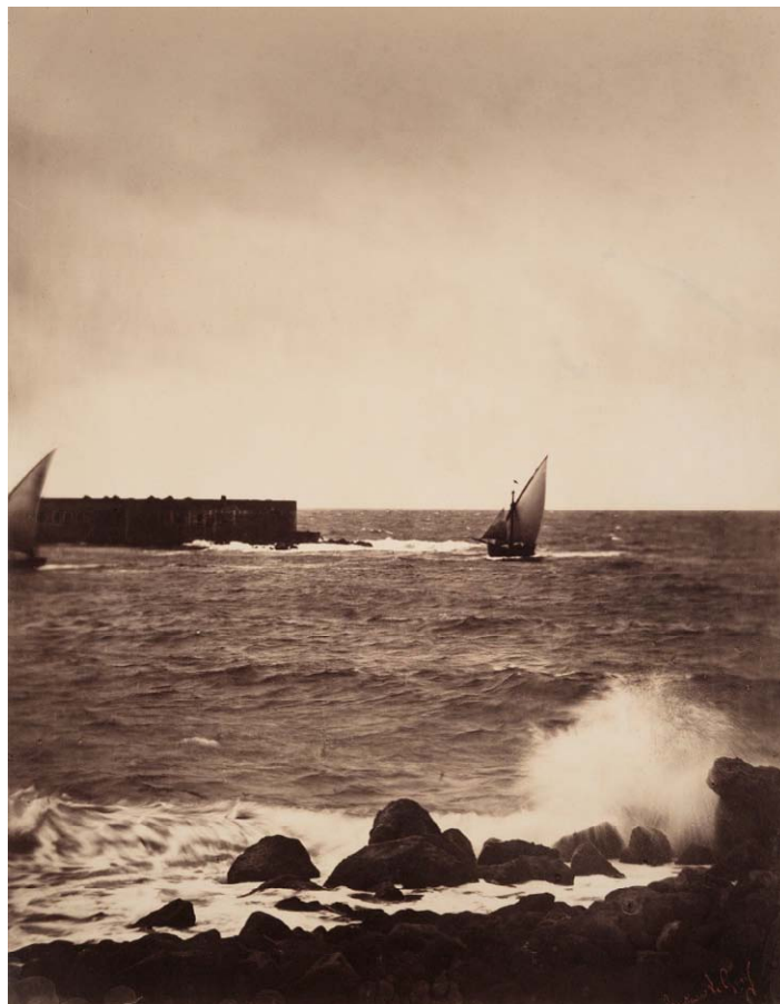
Gustave LE GRAY (1820-1884) La vague brisée - [Sète] - Mer Méditerranée, 1857

Épreuve d'époque sur papier albuminé d'après négatif verre au collodion. Signature "Gustave Le Gray" à l'encre rouge apposée par un timbre humide sur l'image à l'angle inférieur droit. Montage sur support bristol d'époque. Image : 41,8 x 32,6 cm. Support : 62,5 x 43,2 cm.