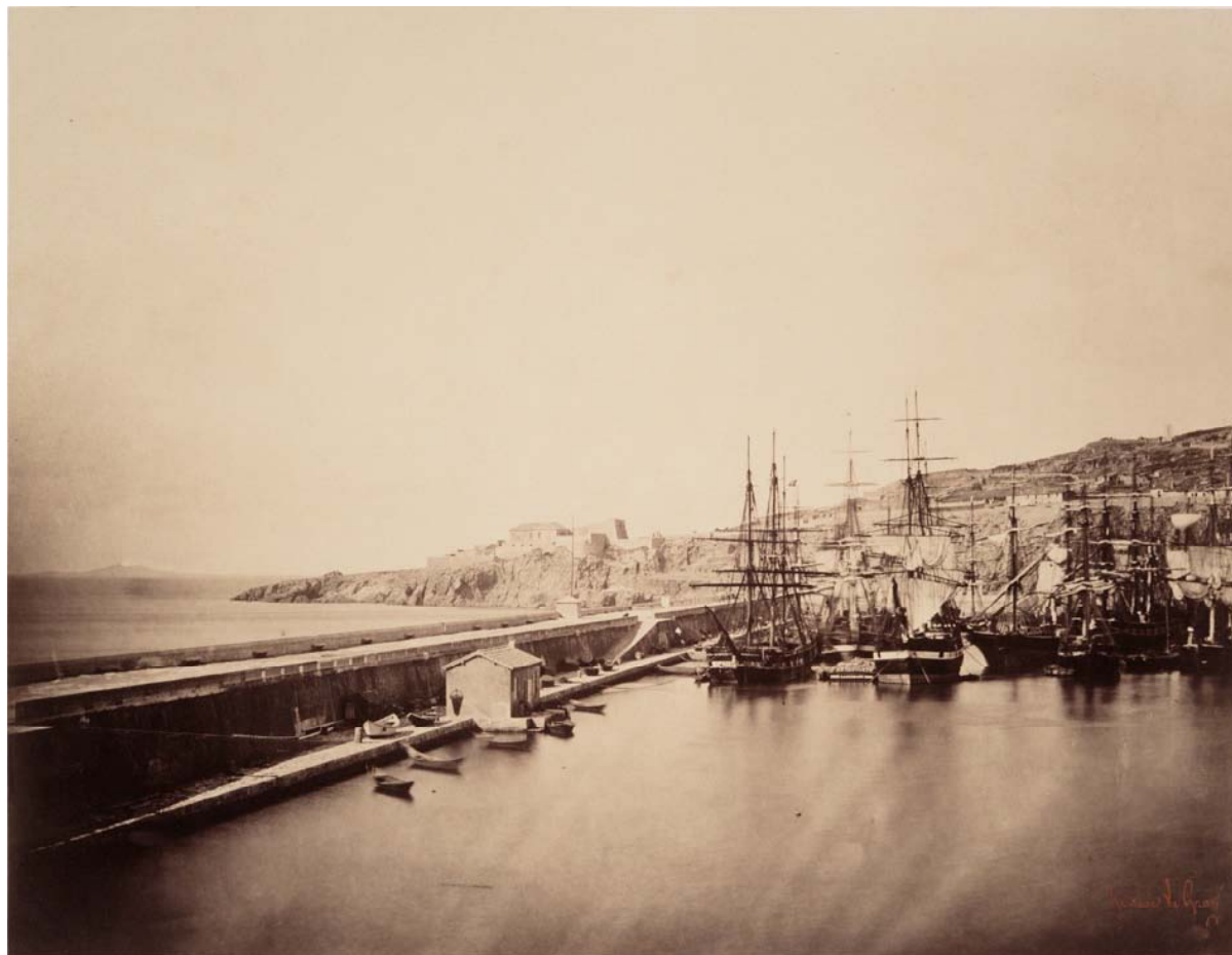
Gustave LE GRAY (1820-1884) Jetée de Cète [Sète] - Mer Méditerranée, 1857

Épreuve d'époque sur papier albuminé d'après négatif verre au collodion. Signature "Gustave Le Gray" à l'encre rouge apposée par un timbre humide sur l'image à l'angle inférieur droit. Partie du timbre sec ovale : "photographie Gustave Le Gray & Co", en bas, au centre du support de montage d'époque. Image : 31,1 x 40,4 cm. Support : 43,4 x 62,7 cm.