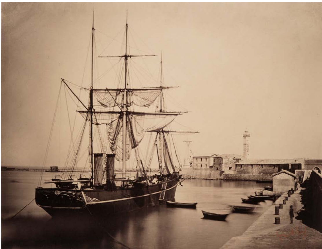
Gustave LE GRAY (1820-1884) Le Saïd - Rade de Cette [Sète] - Mer Méditerranée, 1857

Épreuve d'époque sur papier albuminé d'après négatif verre au collodion. Signature "Gustave Le Gray" à l'encre rouge apposée par un timbre humide sur l'image à l'angle inférieur droit.